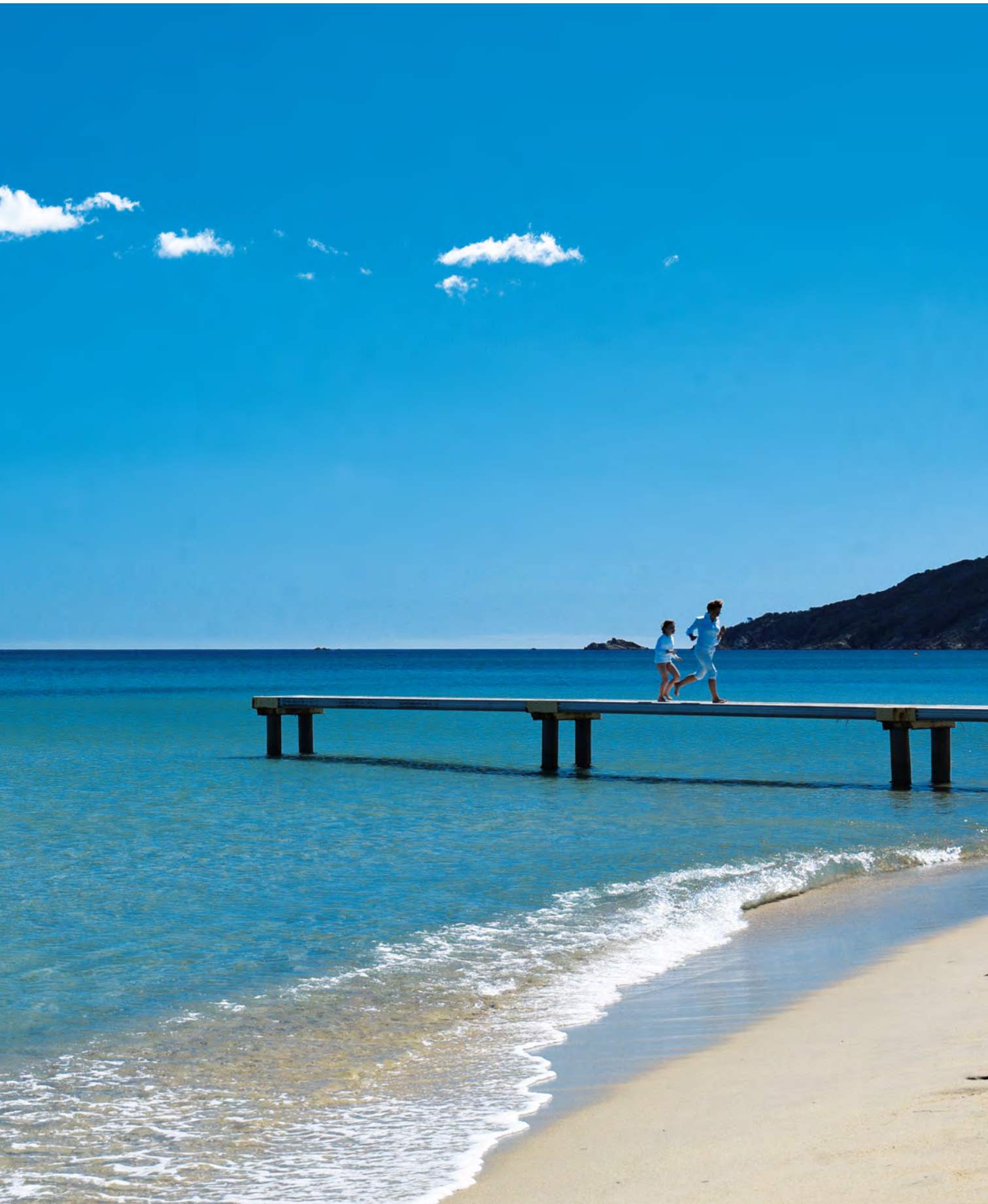
La plage de Pampelonne à Ramatuelle