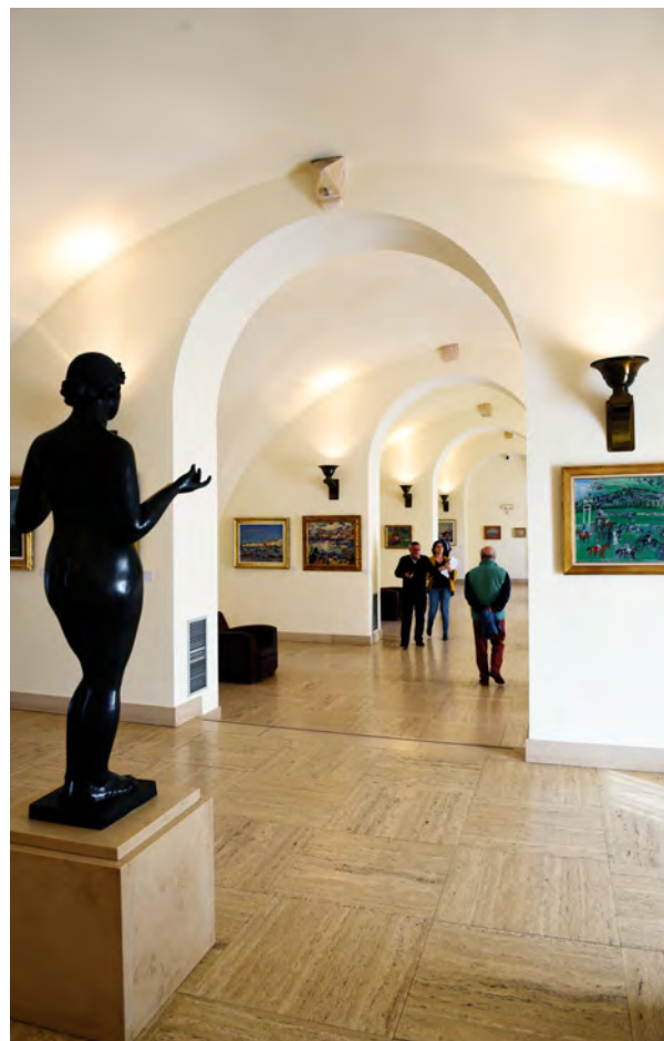
Musée de l'Annonciade à Saint-Tropez

Les grands événements culturels font également la renommée du Golfe. Le Festival de Ramatuelle (voir Portfolio p.5) offre au début du mois d'août, depuis 33 ans, des soirées de théâtre, d'humour ou de musiques actuelles, de très grande qualité. Il est devenu l'une des manifestations incontournables de la saison estivale. (suite p.59)