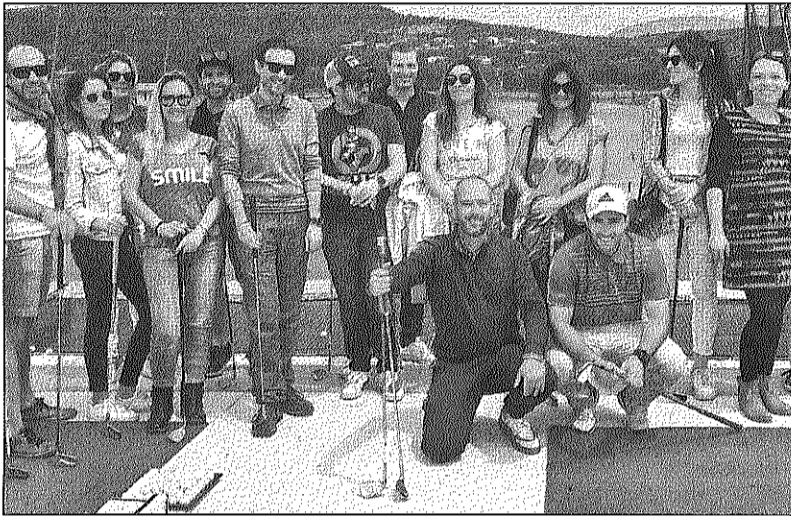
Le dernier instameet a eu lieu en 2019, avant une pause de deux ans en raison de la pandémie.

Il y en aura une vingtaine, tous des adeptes du réseau social Instagram. Ils cumulent plus de 300 000 abonnés au total. Originaires du golfe de Saint-Tropez et du reste de la région, ces influenceurs sont invités par l'agence de promotion touristique locale afin de donner envie à leurs abonnés de venir visiter le Golfe. Ce samedi, ils embarqueront en maxi-catamaran depuis les marines de Cogolin en direction de la baie des Canoubiers pour des activités nautiques : baignade, kayak, paddle. Ils se dirigeront ensuite vers Cavalaire pour un pique-nique sur la plage de Sentporteu et une balade sur le ponton de Fenouillet. « L'idée est de créer du contenu toute la journée, des stories [courtes vidéos postées en direct sur les réseaux sociaux N.D.L.R.] mais aussi des photos postées les jours qui suivent », fait savoir Sandra Castor, community manager et animatrice numérique du territoire. Le but ? « Participer au rayonnement du territoire, à la notoriété de la mar-