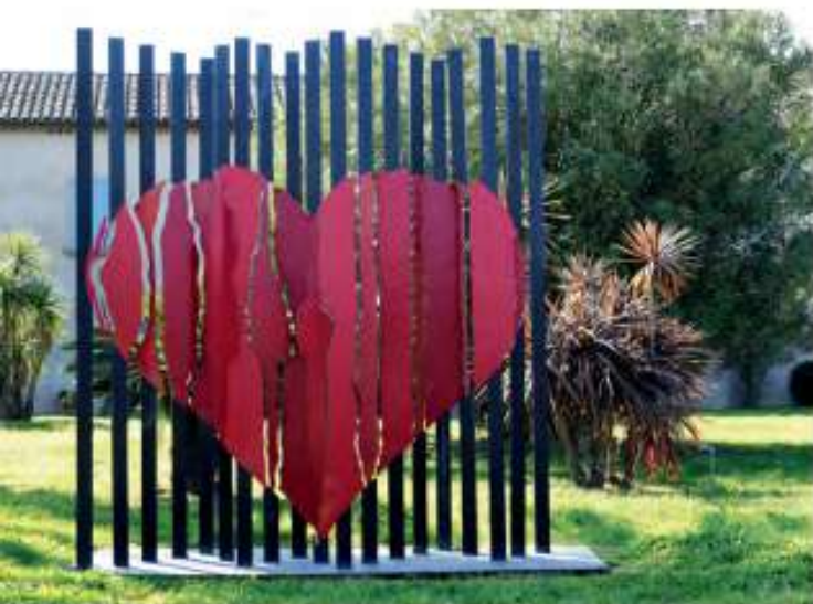
Découvrez L'amour au Château des Marres, une œuvre de The Coolguys.