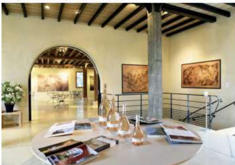
Un magnifique espace d'exposition jouxte la boutique.