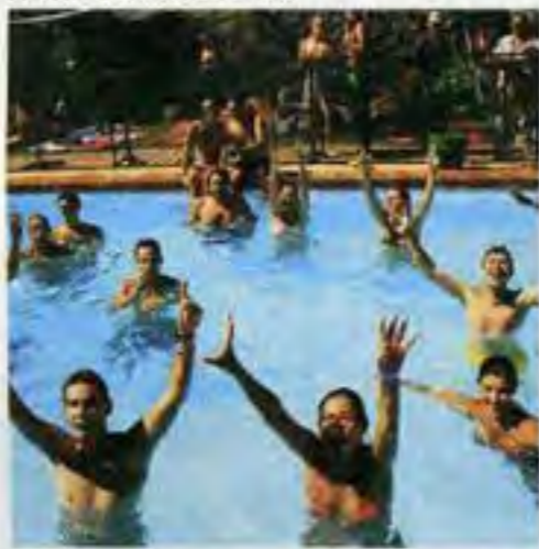
Où danser ? Plages privées en pages "Tout l'été"