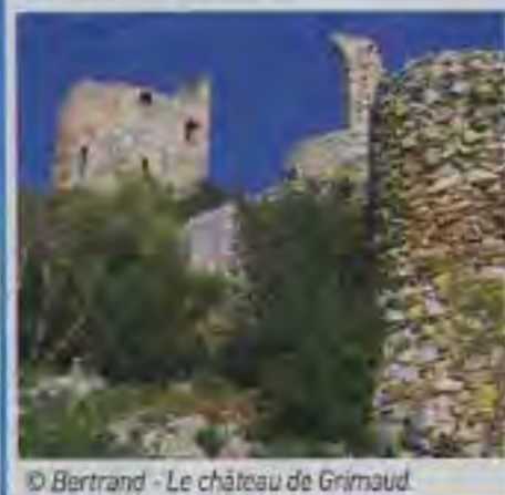
© Bertrand - Le château de Grimaud.

Où danser ? Plages privées en pages "Tout l'été"